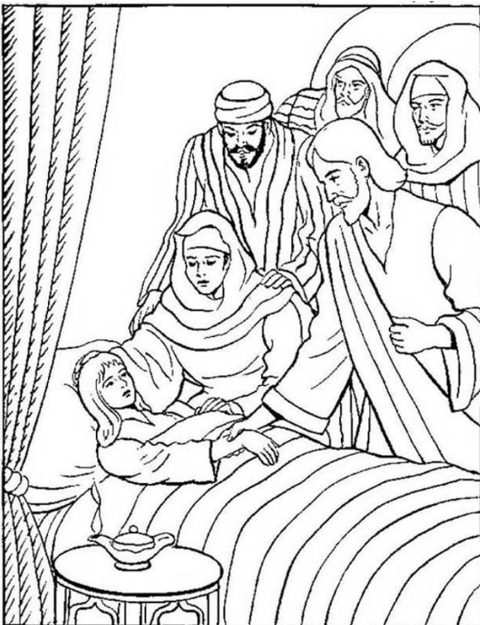
HET DOCHTERTJE VAN JAÏRUS OPGEWEKT.